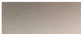
metallo cromato lucido glossy chromed metal