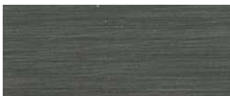
metallo brunito spazzolato a mano hand-finished burnished metal