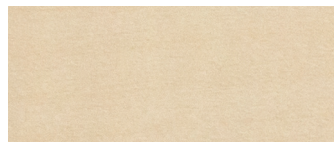
acero naturale natural maple