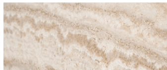
marmo Travertino White stuccato con resina trasparente e finitura spazzolata Travertino White marble filled with transparent resin and brushed finish