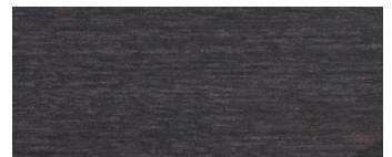
acero tinto con anilina nera black aniline dyed maple