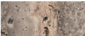
marmo Travertino Silver stuccato con resina trasparente e finitura spazzolata Travertino Silver marble filled with transparent resin and brushed finish