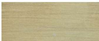
metallo ottonato satinato satin brass-coated metal