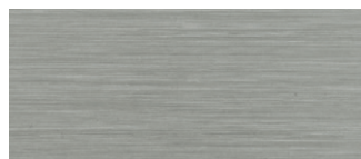
metallo nichelato satinato satin nicked metal