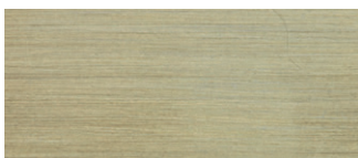
metallo ottonato satinato satin brass-coated metal