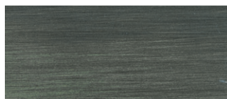
metallo brunito spazzolato a mano hand-finished burnished metal